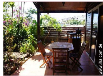
Außenanlage zur Verfügung der Gäste