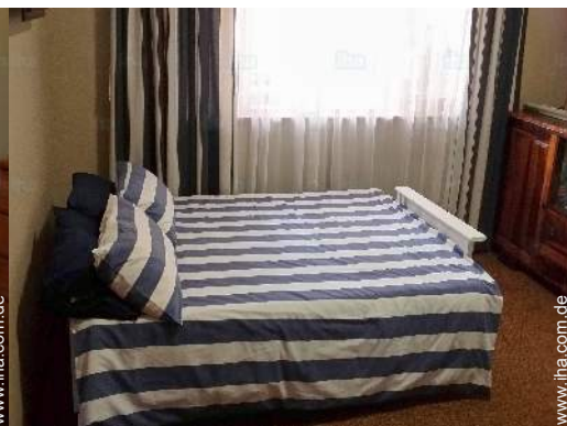
Innenkomfort zur Verfügung der Gäste