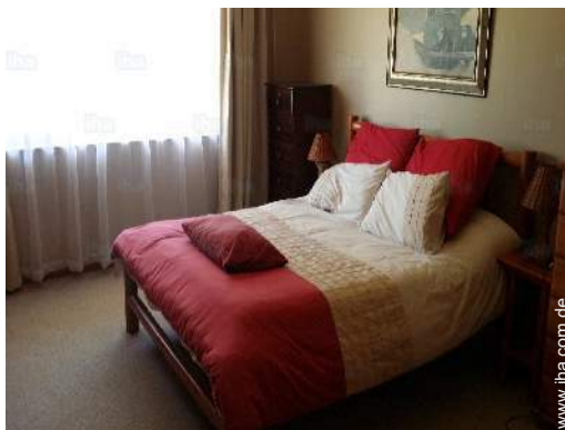
Innenkomfort zur Verfügung der Gäste