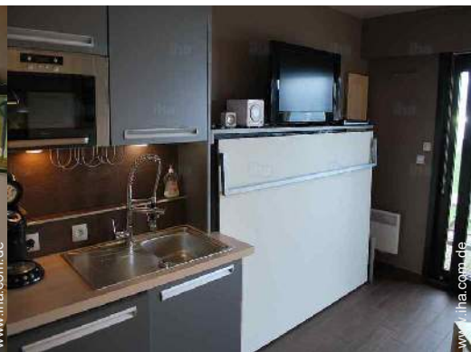
Schrankbett(en) 2 Personen