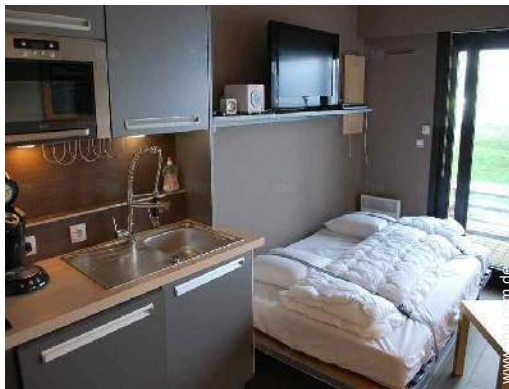
Schrankbett(en) 2 Personen