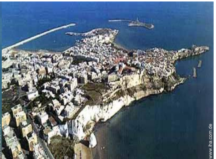
Nahe gelegene Städte