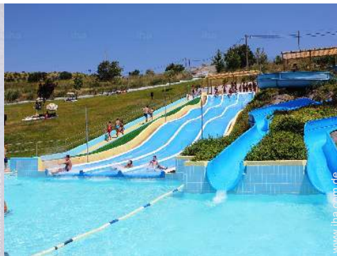
Freizeitaktivitäten in der Nähe