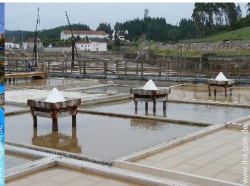
Freizeitaktivitäten in der Nähe