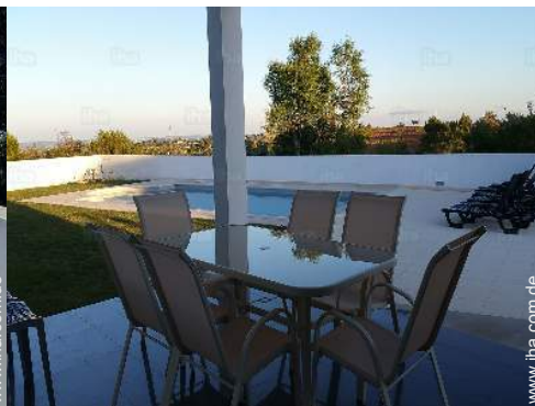
Ausblick überdachte Terrasse