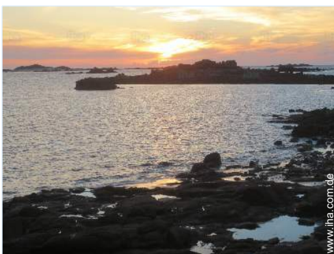
Blick auf Sonnenuntergang

Besondere Vorzüge : Direkter Zugang zum Strand