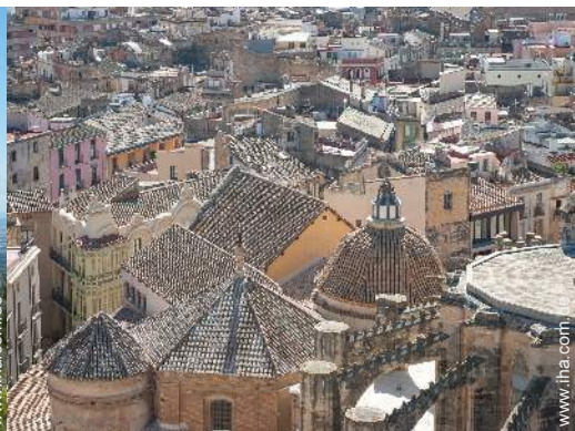
Nahe gelegene Städte