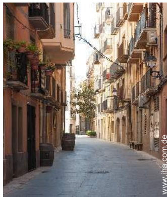
Nahe gelegene Städte