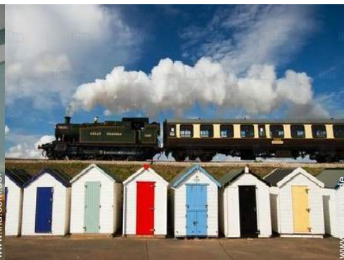
Attraktionen und Entspannung