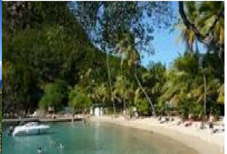
Freizeitaktivitäten in der Nähe