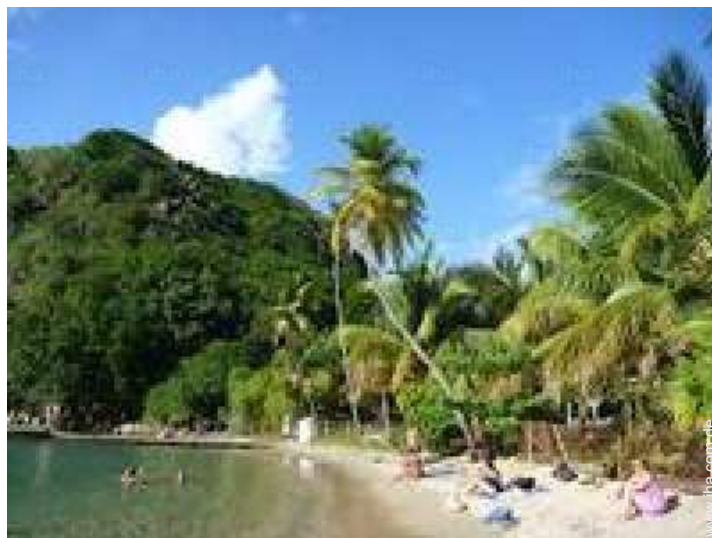
Freizeitaktivitäten in der Nähe