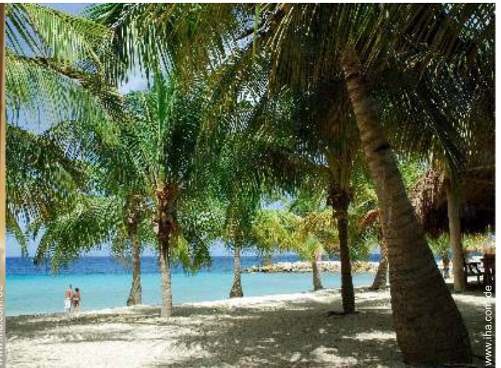
direkter Zugang zum Strand