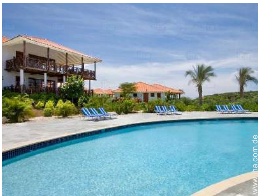
Blick auf Swimmingpool