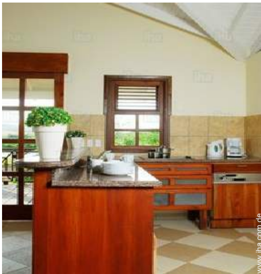
große amerikanische Küche