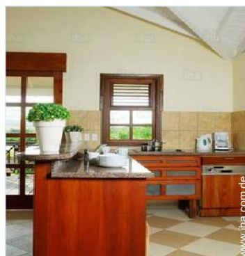
große amerikanische Küche