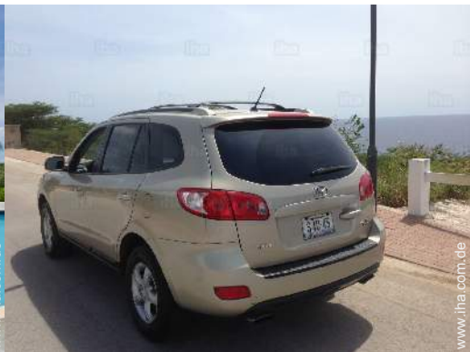
Fahrzeug mit Allradantrieb