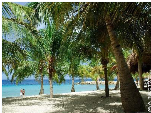
direkter Zugang zum Strand