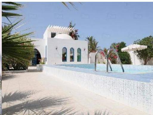
Blick auf Swimmingpool