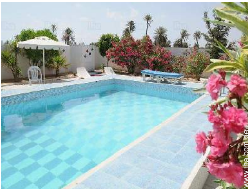
Blick auf Swimmingpool