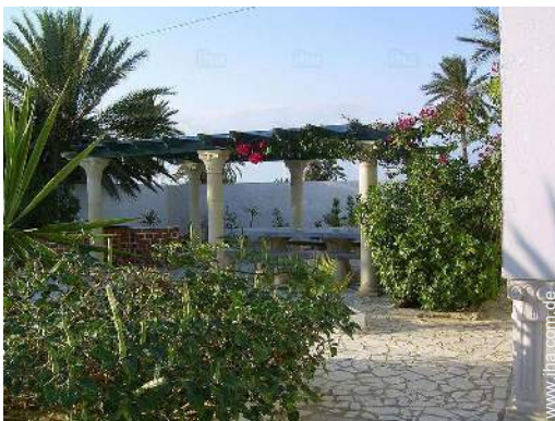
Ausblick überdachte Terrasse