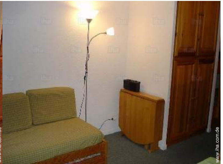
Schrankbett(en) 2 Personen