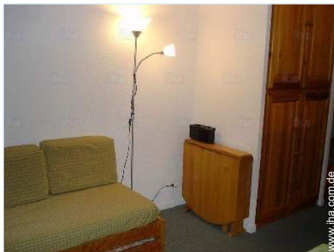
Schrankbett(en) 2 Personen