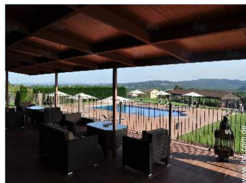
Ausblick überdachte Terrasse