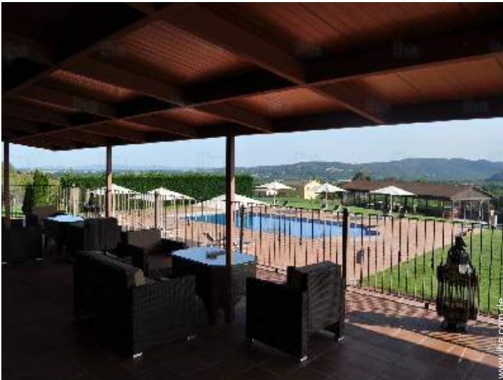
Ausblick überdachte Terrasse