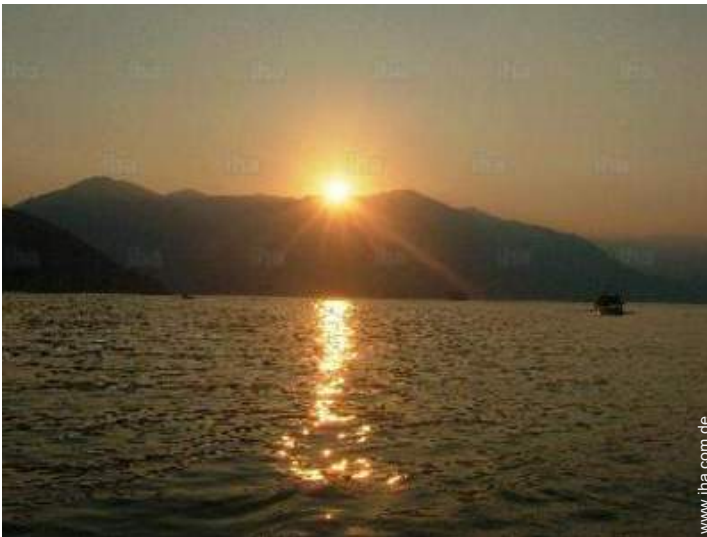
Blick auf Sonnenuntergang