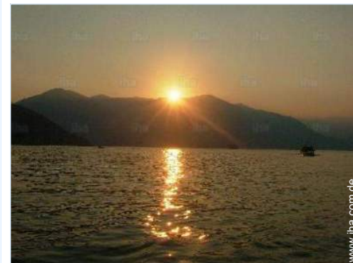
Blick auf Sonnenuntergang