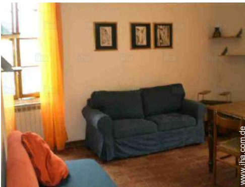
Sofabett(en) 2 Personen