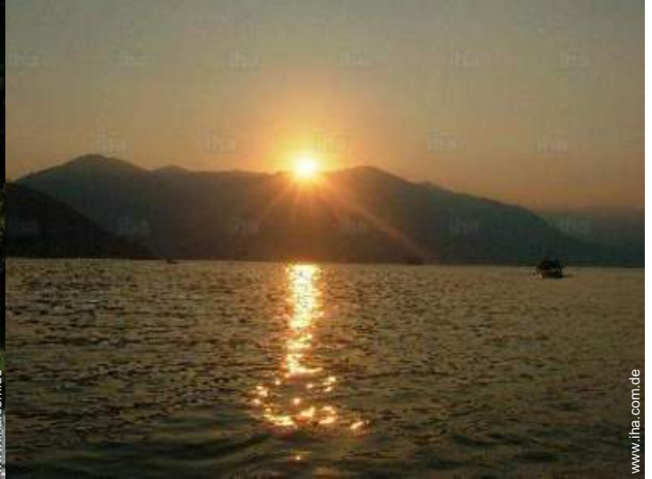
Blick auf Sonnenuntergang