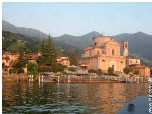
Blick auf Dorfzentrum