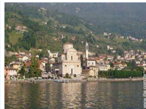
Blick auf Dorf

Örtliche Geschäfte 300m Supermarkt 500m Luxus-/Markenboutiquen 7,5km Friseursalon 500m Post 500m Bank 300m Apotheke 1km Arzt 800m Krankenhaus 7,5km Ambulanz 800m