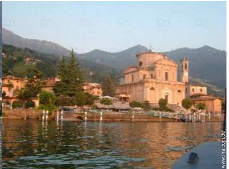
Blick auf Dorfzentrum