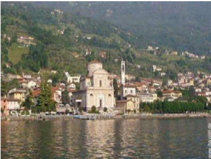
Blick auf Dorf