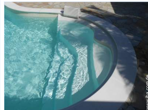
Blick auf Swimmingpool