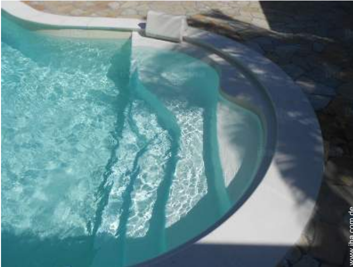
Blick auf Swimmingpool