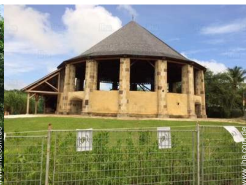
In der Nähe