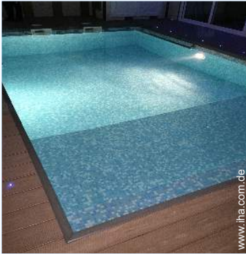
Swimmingpool im Haus