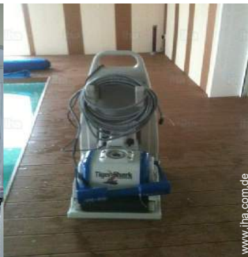
Swimmingpool im Haus