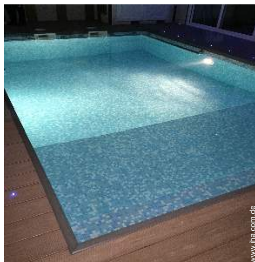
Swimmingpool im Haus