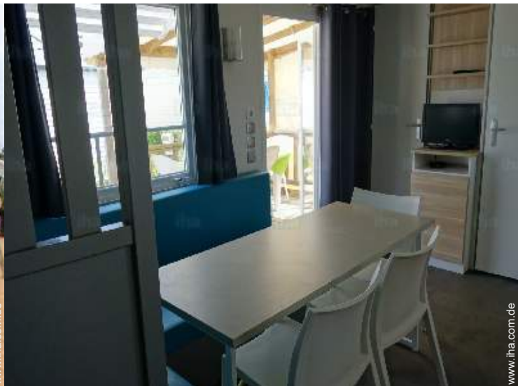
Innenkomfort und Ausstattung