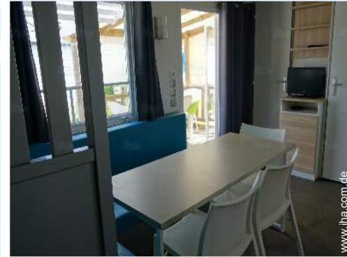
Innenkomfort und Ausstattung