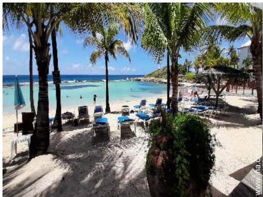
Blick aufs Meer