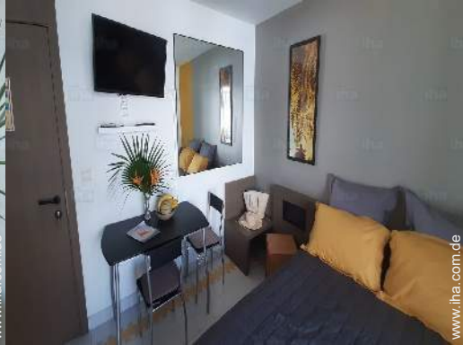
Raumaufteilung und Annehmlichkeiten