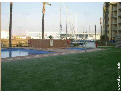
Blick auf Hafen