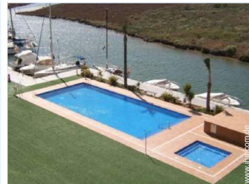
Außenanlage zur Verfügung der Gäste