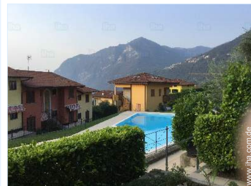
Blick auf Swimmingpool