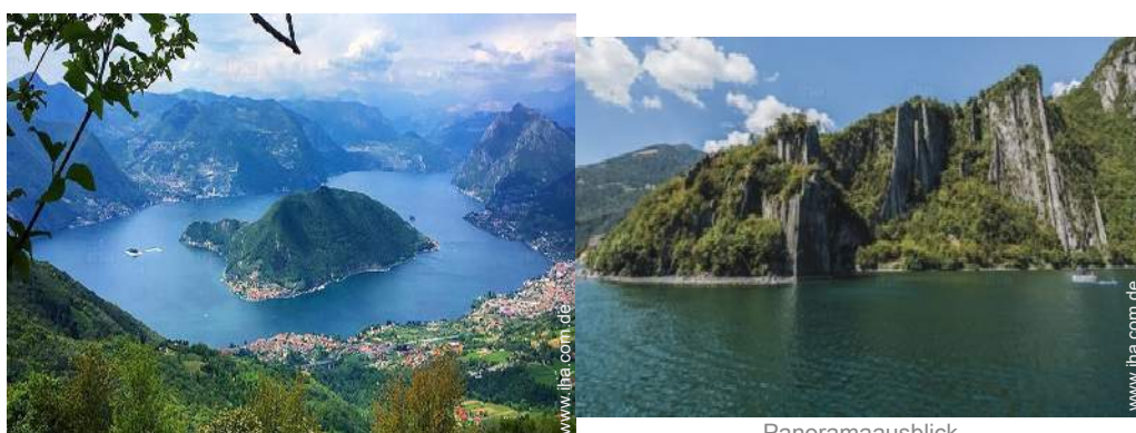
Blick auf See