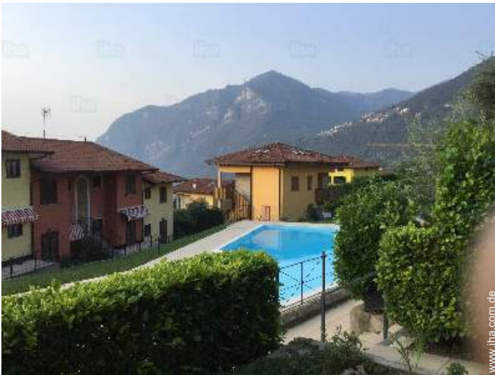
Blick auf Swimmingpool