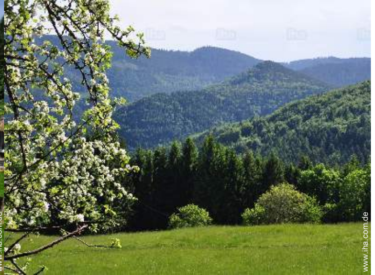
Blick auf Wald