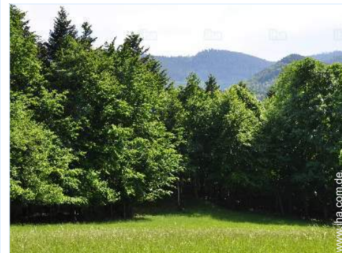
Blick auf Wald