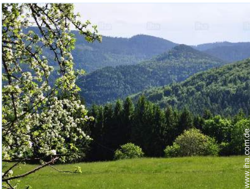
Blick auf Wald