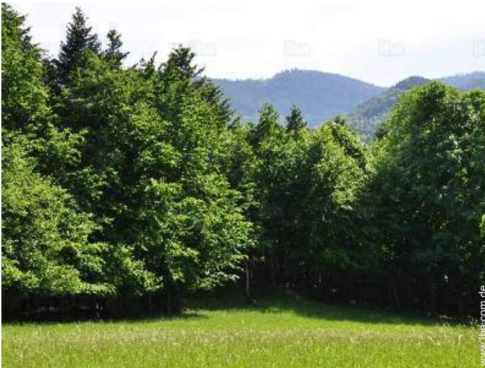
Blick auf Wald