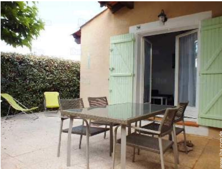
Blick auf Hof