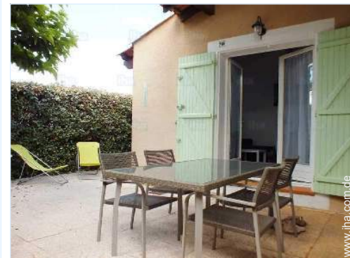
Blick auf Hof