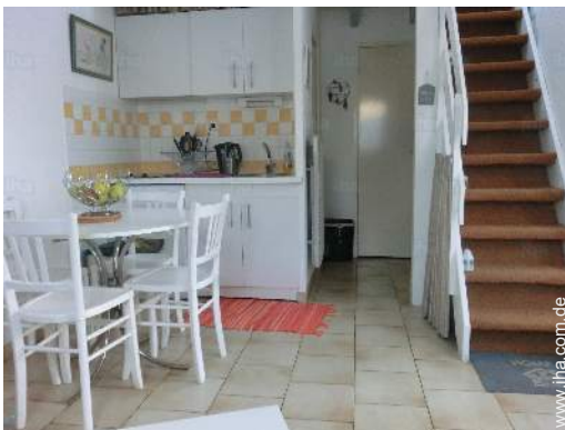
Raumaufteilung und Annehmlichkeiten