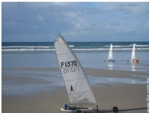
Wassersport in der Nähe