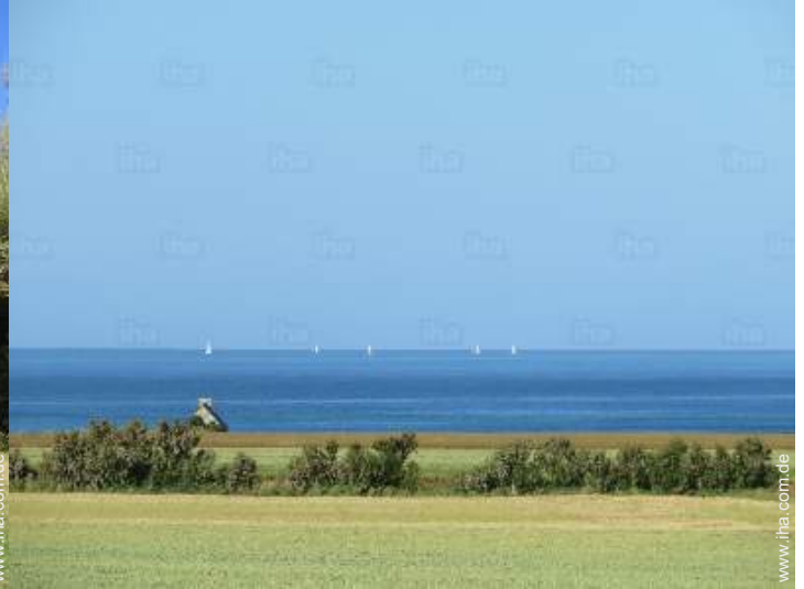
Blick aufs Meer