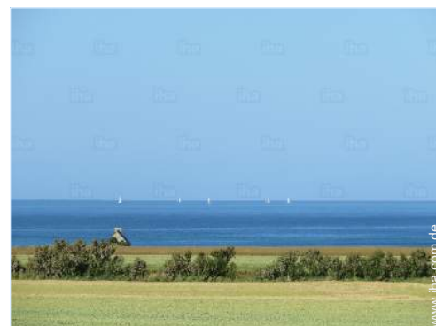
Blick aufs Meer