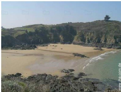
In der Nähe