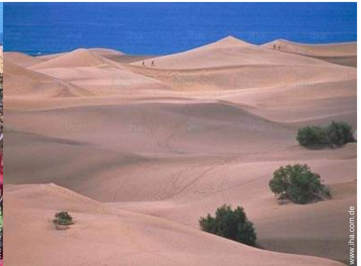
In der Nähe