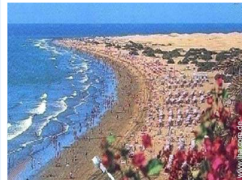
In der Nähe