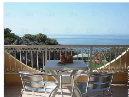
Blick aufs Meer