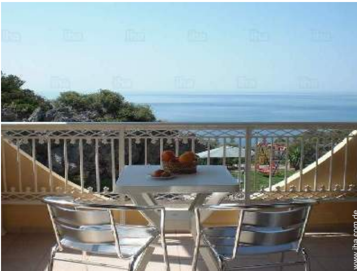
Blick aufs Meer