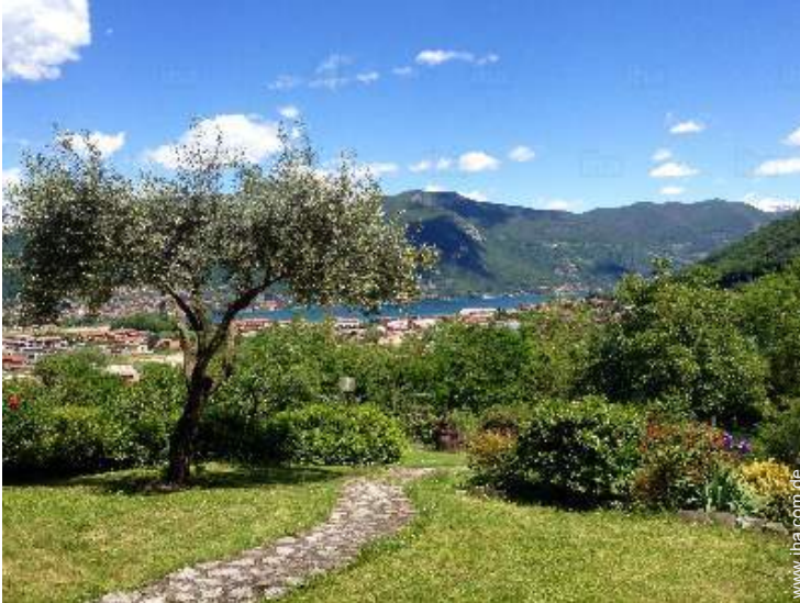
Blick auf Garten/Park