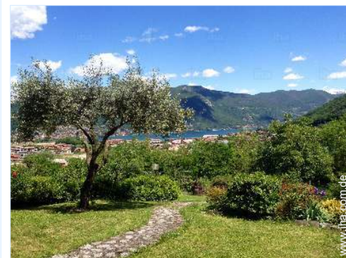
Blick auf Garten/Park

Kiesstrand 1km Felsstrand 1km Öffentlicher Tennisplatz 1km 18-Loch-Golfplatz 10km Windsurf-Spot 15km Surf-Spot 15km Wassersport-Center 2km See 1km Wald <50m Helling für Boote 1km Helling für Jetskis 1km