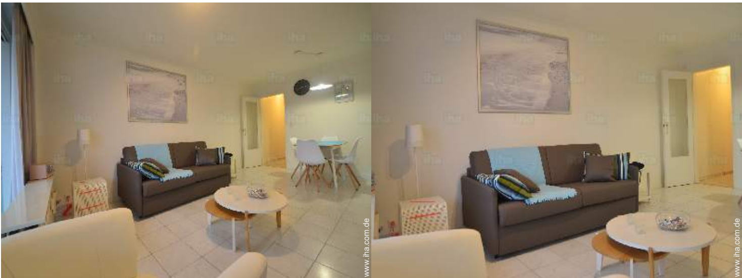
Raumaufteilung und Annehmlichkeiten