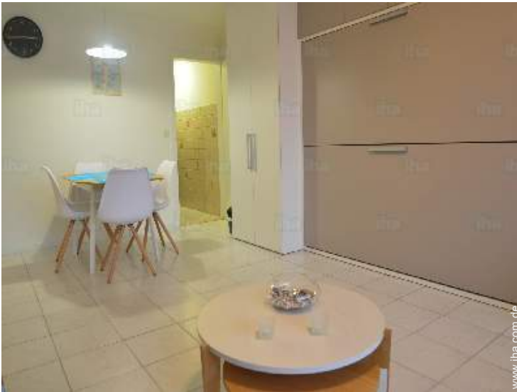
Innenkomfort und Ausstattung