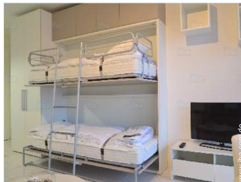
Schrankbett(en) 1 Person