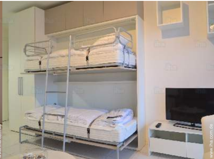
Schrankbett(en) 1 Person