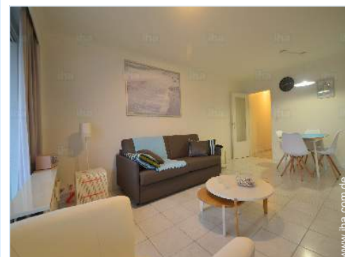
Raumaufteilung und Annehmlichkeiten