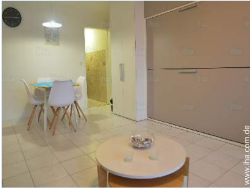
Innenkomfort und Ausstattung