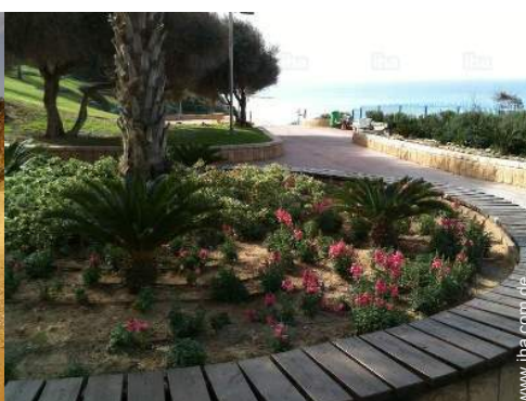
Freizeitaktivitäten in der Nähe