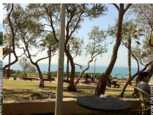
Park und Garten