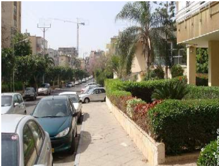
Blick auf Straße/Avenue