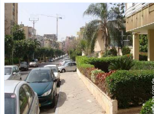
Blick auf Straße/Avenue