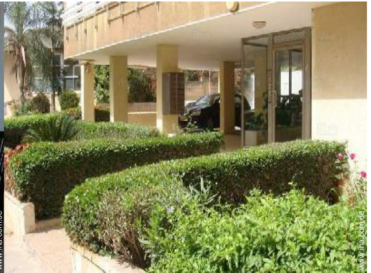
Blick auf Straße/Avenue