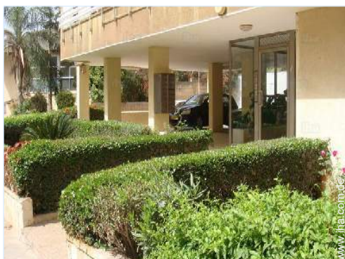
Blick auf Straße/Avenue