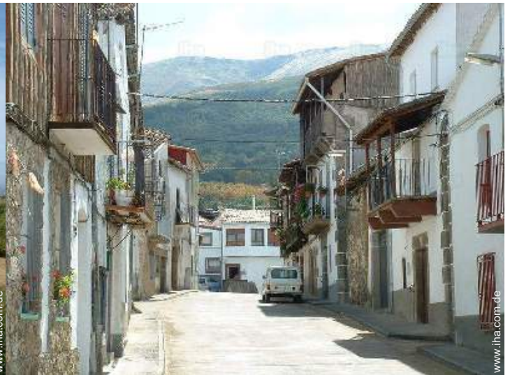
Blick auf Dorf