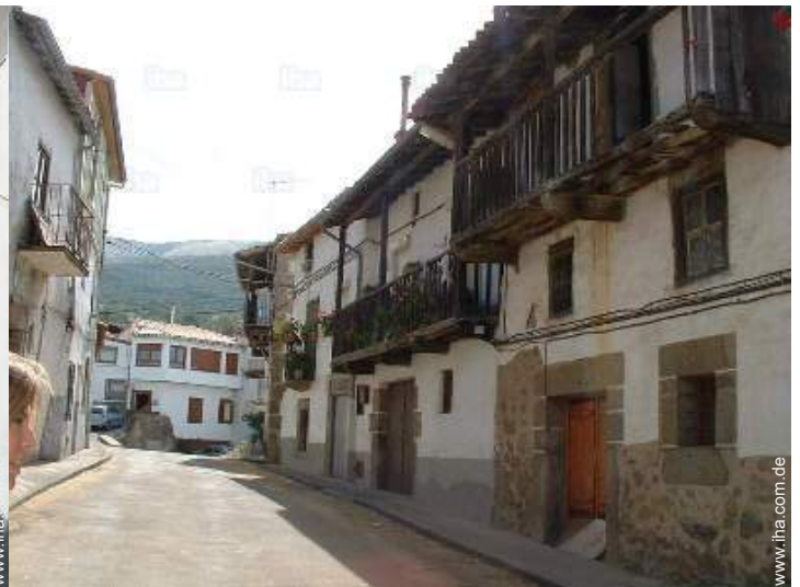
Blick auf Dorfzentrum