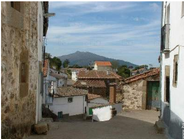
Blick auf Dorf