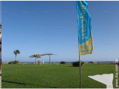
Attraktionen und Entspannung