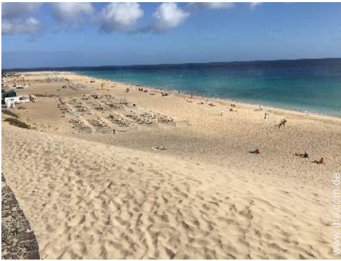
In der Nähe