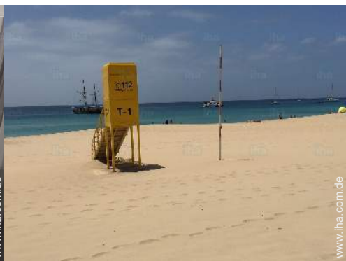
In der Nähe