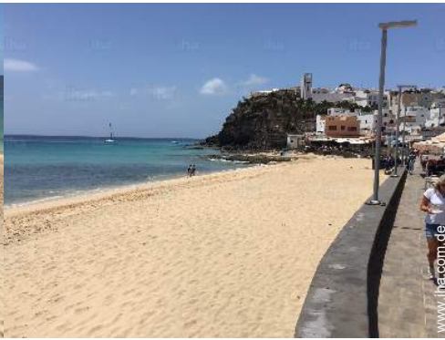
In der Nähe