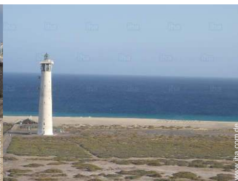
In der Nähe