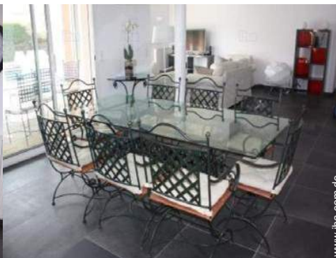
Raumaufteilung und Annehmlichkeiten