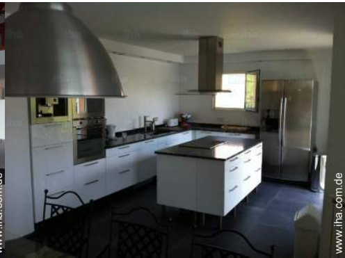
große amerikanische Küche