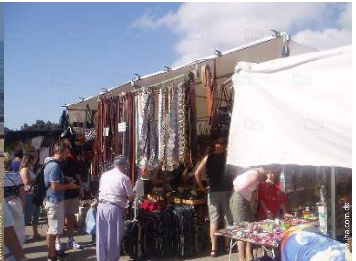
In der Nähe