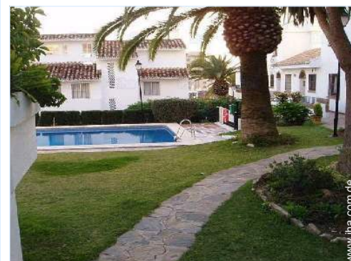
Swimmingpool in Wohnanlage