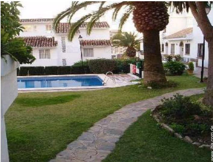
Swimmingpool in Wohnanlage