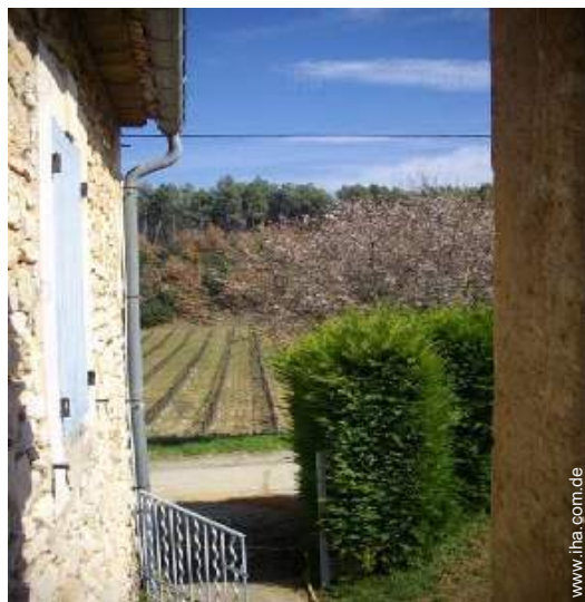
Blick auf Weinberge