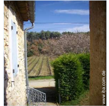
Blick auf Weinberge