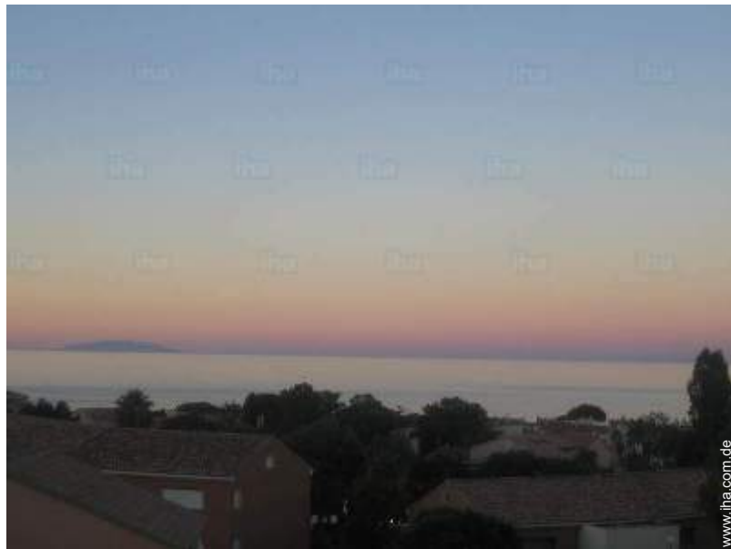
Blick aufs Meer