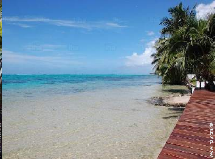
Blick aufs Meer