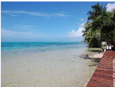
Blick aufs Meer

Besondere Vorzüge : Privater Anlegesteg, Ankerplatz