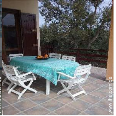
Ausblick überdachte Terrasse