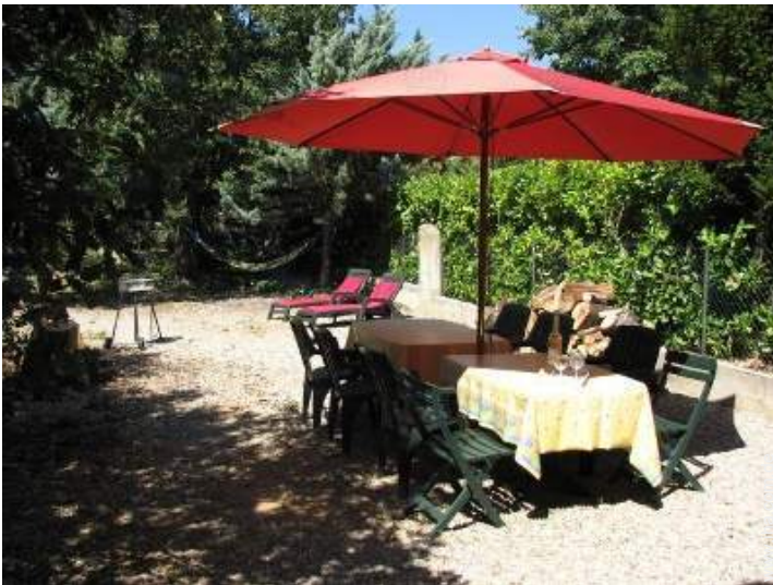
Blick auf Garten/Park