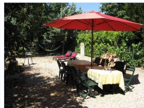
Blick auf Garten/Park