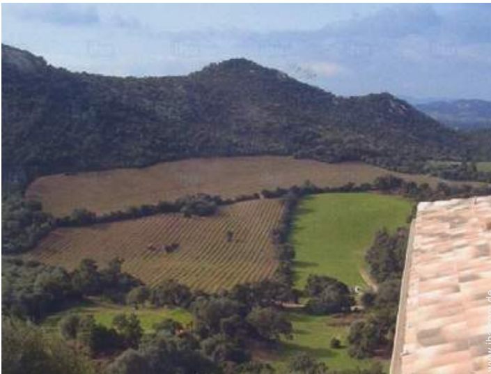
Blick auf Weinberge