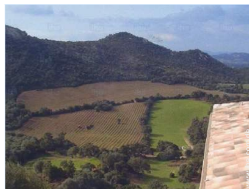
Blick auf Weinberge