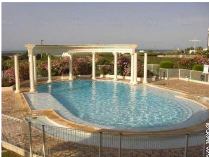
Swimmingpool in Wohnanlage