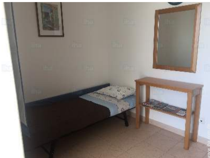
Ausziehbett(en) 1 Person