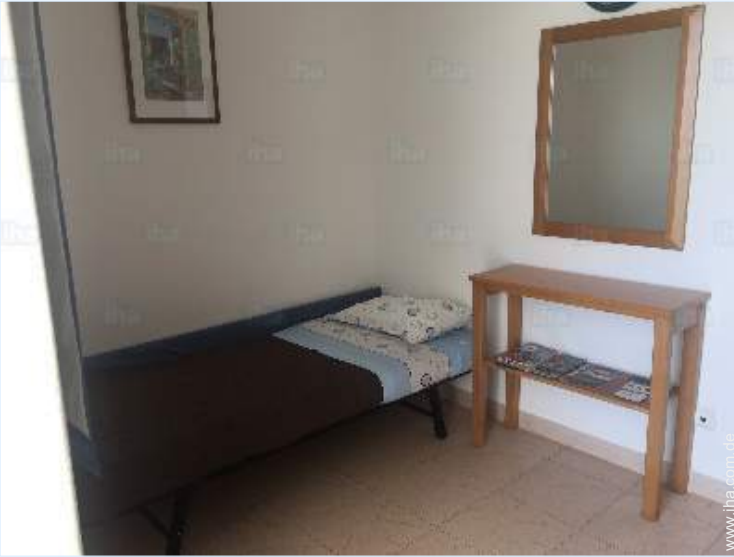
Ausziehbett(en) 1 Person