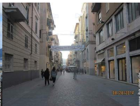
Blick auf Stadtzentrum