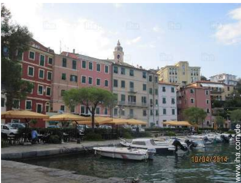
Nahe gelegene Städte