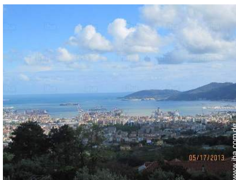
Blick auf Stadt