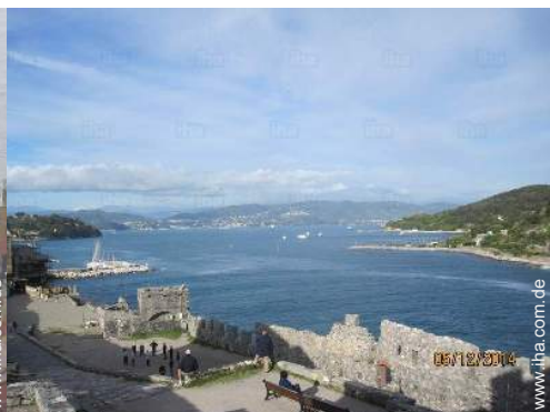
Nahe gelegene Städte