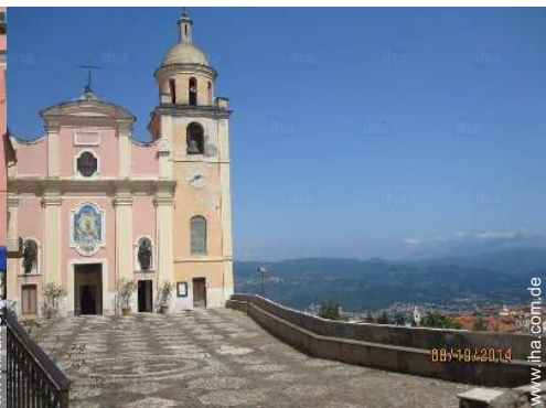
Nahe gelegene Städte