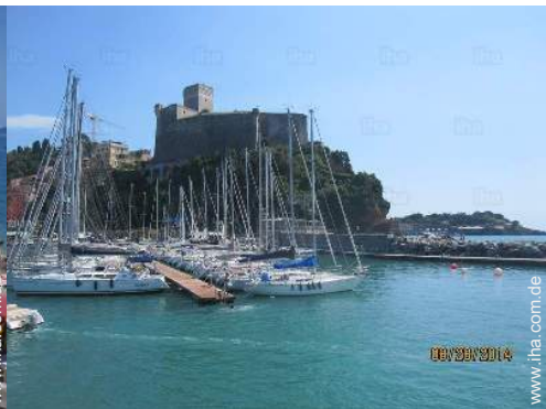
Nahe gelegene Städte