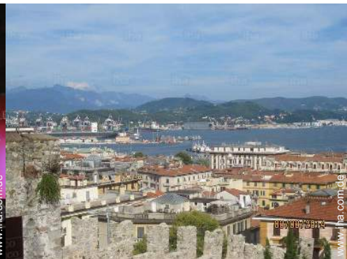
Blick auf Stadt