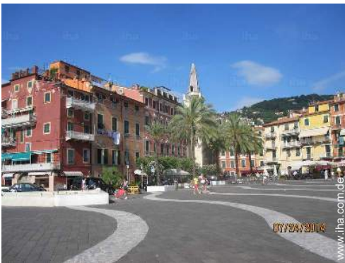
Nahe gelegene Städte