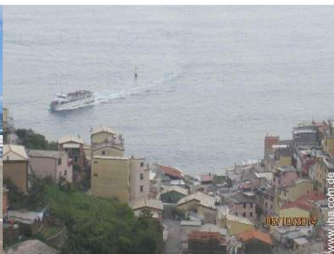
Nahe gelegene Städte