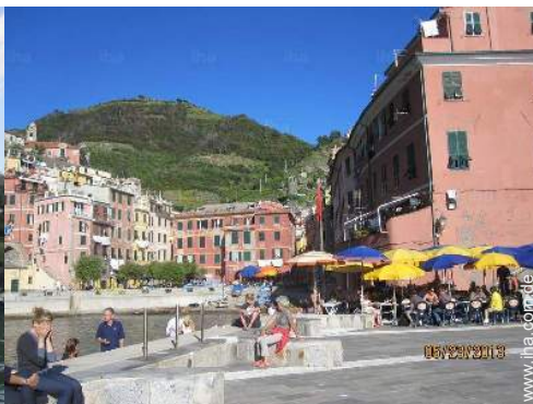
Nahe gelegene Städte