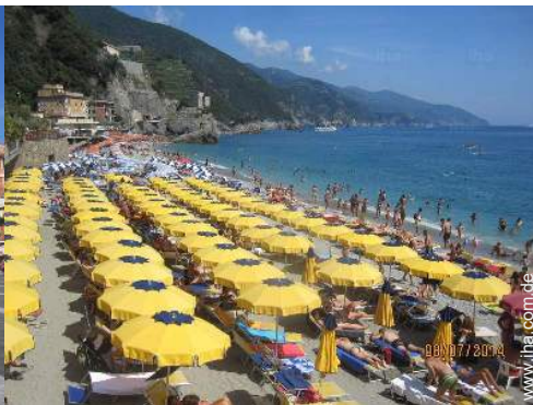
Nahe gelegene Städte