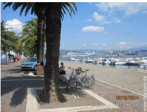
Attraktionen und Entspannung