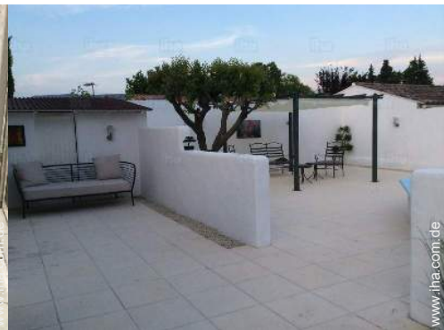
Blick auf Swimmingpool