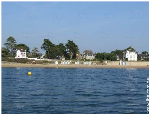
direkter Zugang zum Strand