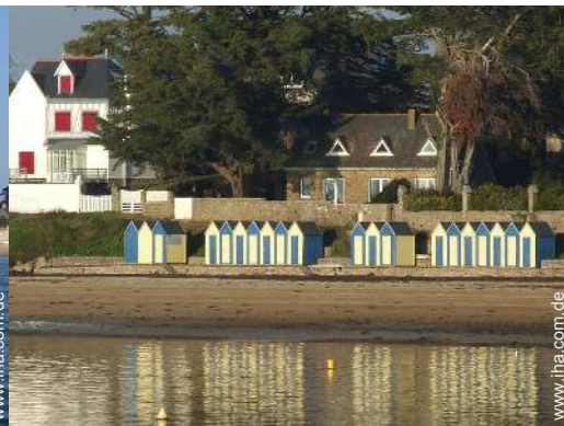
direkter Zugang zum Strand