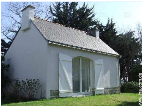
Äußerer Rahmen zur Verfügung der Gäste

Besondere Vorzüge : Direkter Zugang zum Strand