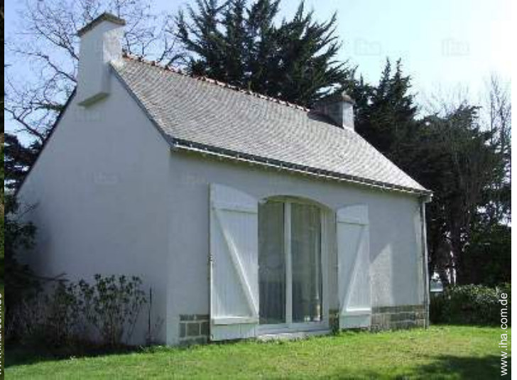
Äußerer Rahmen zur Verfügung der Gäste