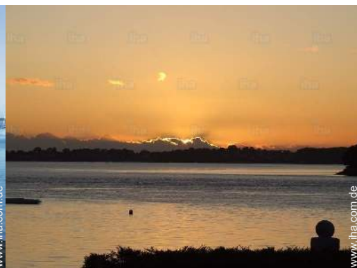
Blick auf Sonnenuntergang