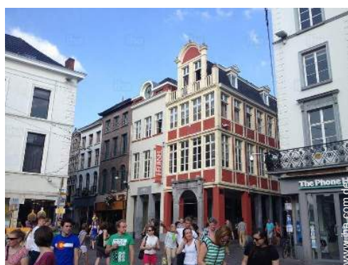
In der Nähe