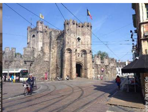
In der Nähe