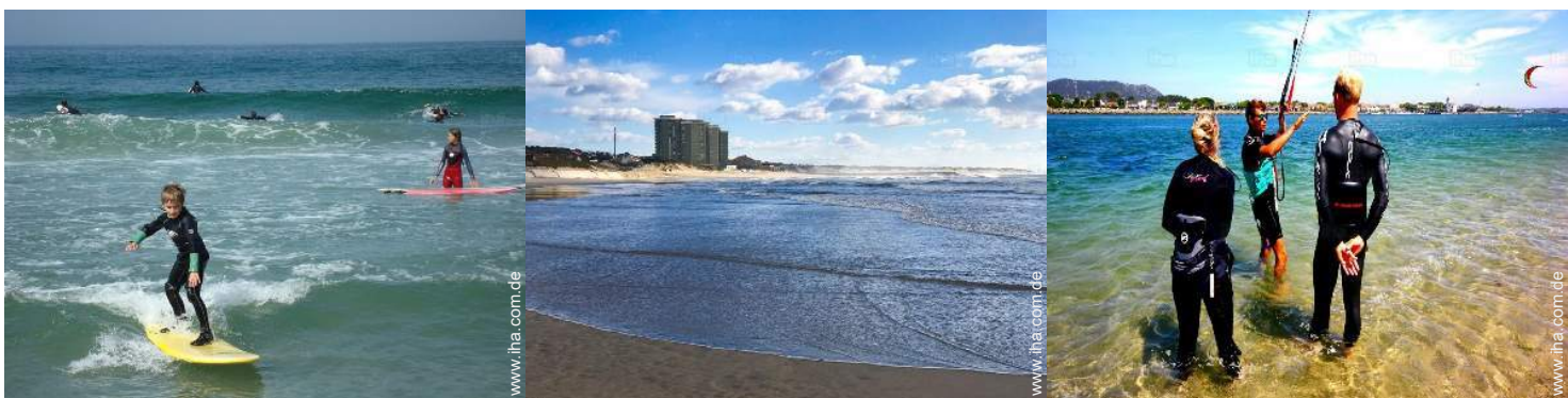
Wassersport in der Nähe