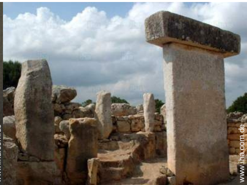
Attraktionen und Entspannung