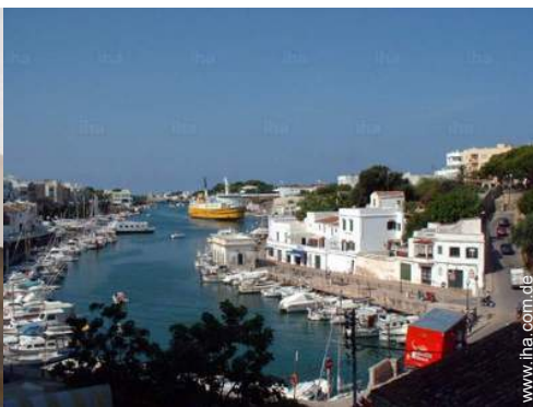
Nahe gelegene Städte