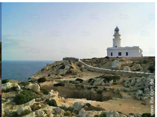
In der Nähe