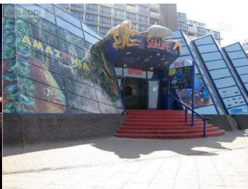
Attraktionen und Entspannung