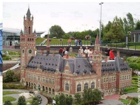
Freizeitaktivitäten in der Nähe