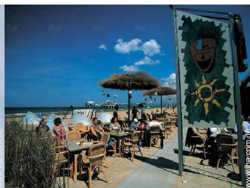
Badevergnügen in der Nähe